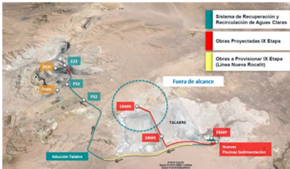
Figura 4-6: Disposición Sistema de Recuperación y Recirculación de Aguas Claras y Aducción Talabre.