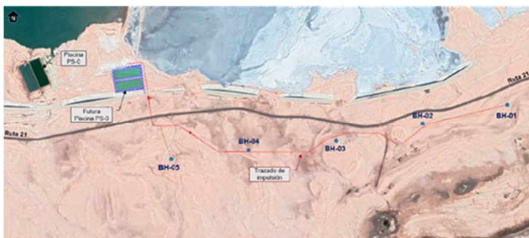
Figura 4-7: Disposición Pozos de Barrera Hidráulica – Pozos Muro Sur Oriente proyectados (Referencial).