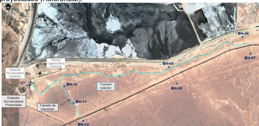
Figura 4-8: Disposición Pozos de Barrera Hidráulica – Pozos Muro Sur proyectados (Referencial).