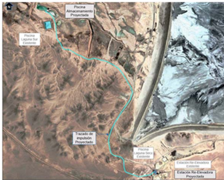
Figura 4-9: Disposición Pozos de Barrera Hidráulica – Impulsión desde Estación Re-Elevadora proyectada hasta Piscina de Acumulación proyectada (Referencial).