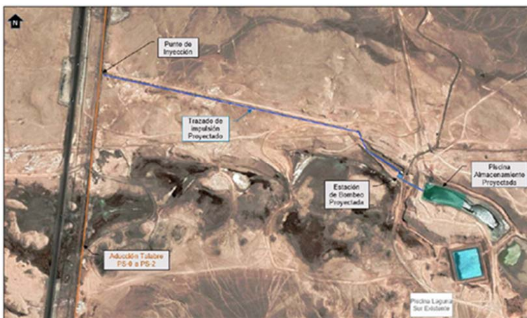
Figura 4-11: Disposición Pozos de Barrera Hidráulica – Trazado y Conexión Línea Matriz de Pozos proyectada con Aducción Talabre (Referencial) (c) Sistema de Monitoreo y Control: