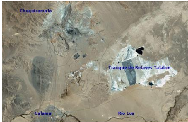
Figura N°2 Ubicación Tranque de Relaves Talabre

El Proyecto se ubica en el distrito minero de Chuquicamata, en la pre-cordillera de la Región de Antofagasta, Comuna de Calama, Provincia de El Loa, a aproximadamente a 15 km al norte de Calama y a 245 km de Antofagasta.