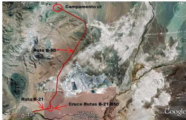
Figura N°1 Mapa Ubicación Campamento VP

Este Campamento lo definen todas las instalaciones correspondientes a Habitación, Casino-Comedor, Recreación, Policlínico, Plantas de Tratamiento de Aguas, Planta de Filtros (Potabilizadora), Grupos Generadores y otros que son necesarios para albergar tanto al personal Contratista como al de CODELCO VP que trabaja en terreno de la compañía durante el desarrollo del o los proyecto(s) que esté(n) en ejecución.