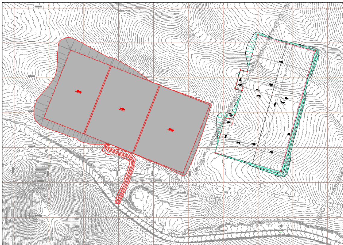
Figura N° 2.2: Disposición general de las plataformas