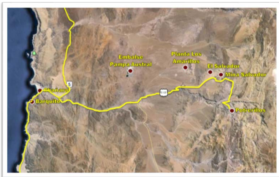
Figura N° 2.1: Ubicación General del Proyecto

El Proyecto Rajo Inca se ubica en el yacimiento El Salvador (DSAL) y se emplaza en distintas zonas de la Tercera Región de Chile. En la Figura N° 2.1 se muestra los sectores de interés del Proyecto.