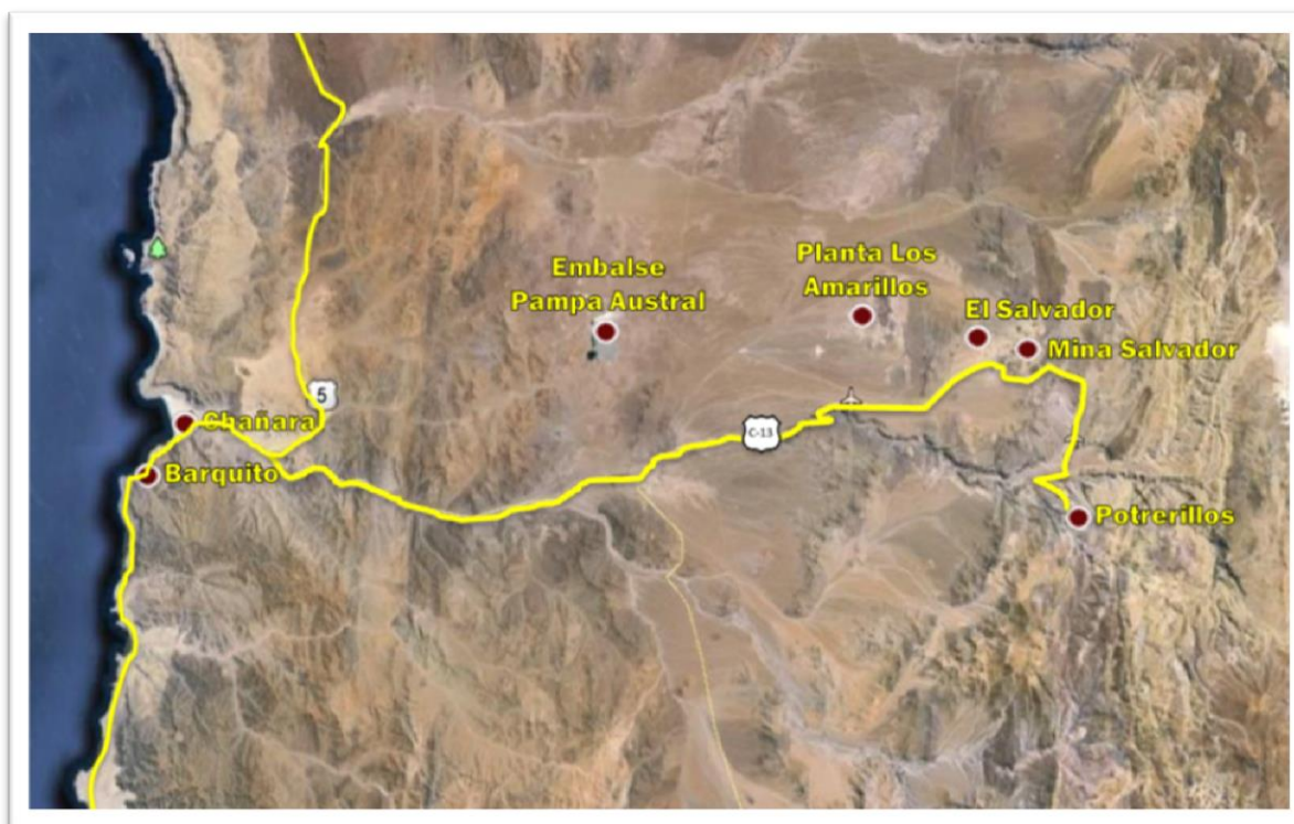
Figura N° 1: Ubicación General del Proyecto

El Proyecto Rajo Inca se ubica en el yacimiento El Salvador (DSAL) y se emplaza en distintas zonas de la Tercera Región de Chile. En la Figura N° 1 se muestra los sectores de interés del Proyecto.