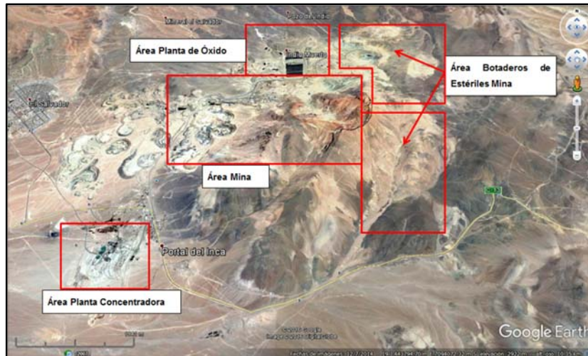
Figura 2: Zoom de la División El Salvador