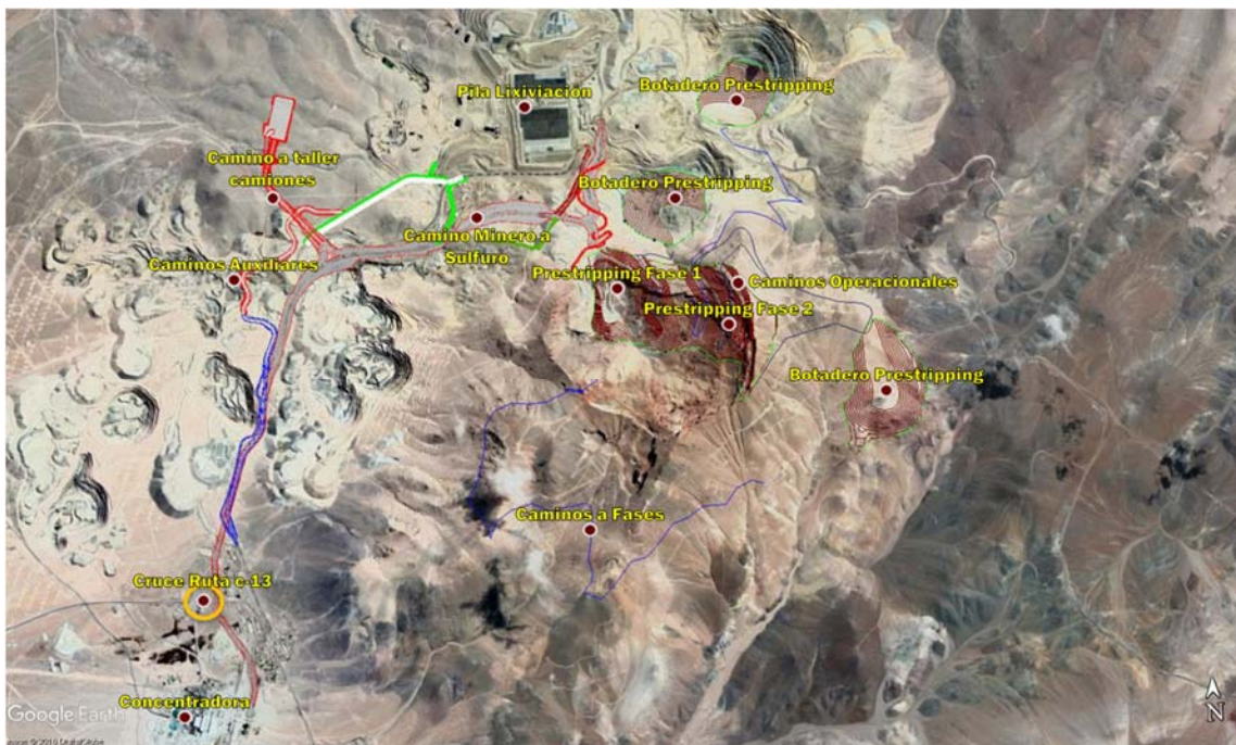
Figura 3: Foto Fin Periodo Pre-producción - Esquemas de obras y caminos

En la siguiente figura se muestran los caminos ex pit, y la pre-producción realizada según plan minero (Foto Fin 2022):