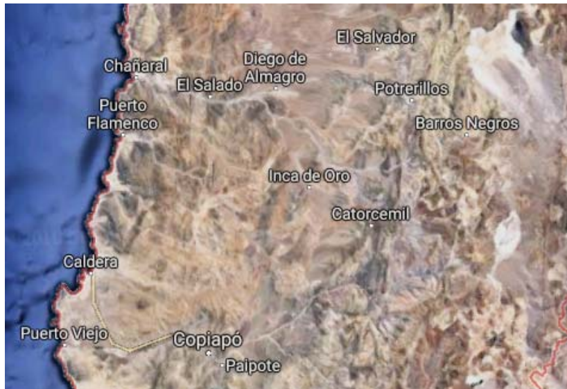
Figura 1: Ubicación en la Región de Atacama de Chile