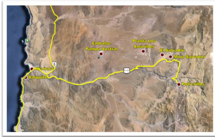
Figura N° 1: Ubicación General del Proyecto

Las faenas de DSAL están ubicadas en la Región de Atacama, a 110 kms al Noreste del puerto de Chañaral, provincia de Chañaral. La altura promedio en el sitio de la mina es de 2.600 m.s.n.m. Las elevaciones del proyecto se enmarca este proyecto, varían entre 0 (Puerto Barquitos) a 3.100 m.s.n.m. (yacimiento)