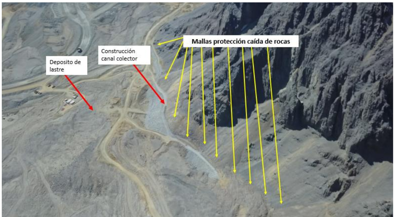
Fig.1 Ubicación esquemática mallas protección caída de rocas

A partir de la revisión Geomecánica de División Andina realizada en el sector Este de la Mina Rajo, se define que para la Construcción de los canales colectores de aguas claras, los cuales se emplazan “aguas arriba” del depósito de lastres existente en el lugar, es necesaria la instalación de sistemas contenedores de caída de rocas para la protección de personas y equipos que realizarán la construcción, como indica la figura 1: