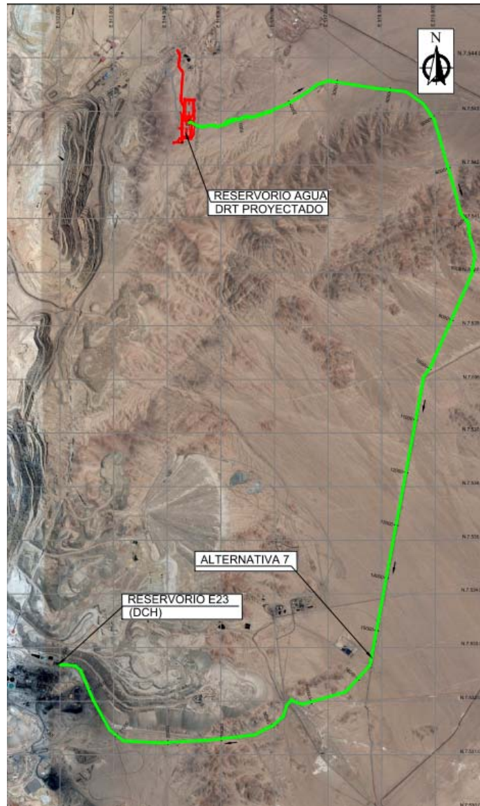
Figura 2-1. Trazado conducción reservorio industrial SADDN a reservorio existente E23 Chuquicamata

En las figuras a continuación se presentan esquemas de las conducciones de agua.