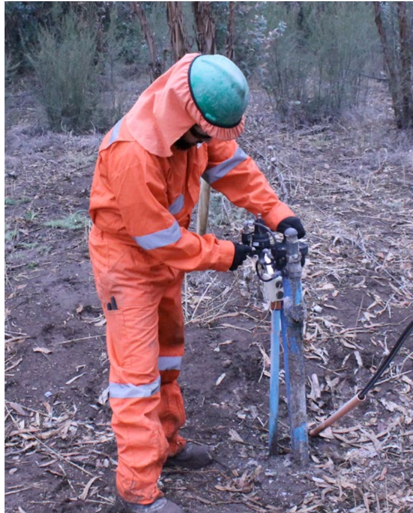
Las empresas ATM y RFV colaboran con acciones de cuidado del medio ambiente en las operaciones del Tranque de Relaves Ovejería.