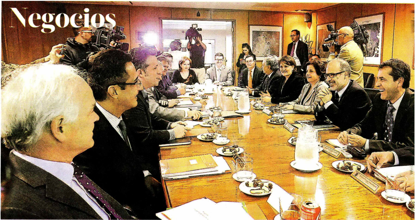
► En la cita participaron los ministros de Hacienda y Minería, el directorio de Codelco y el presidente ejecutivo de la estatal.