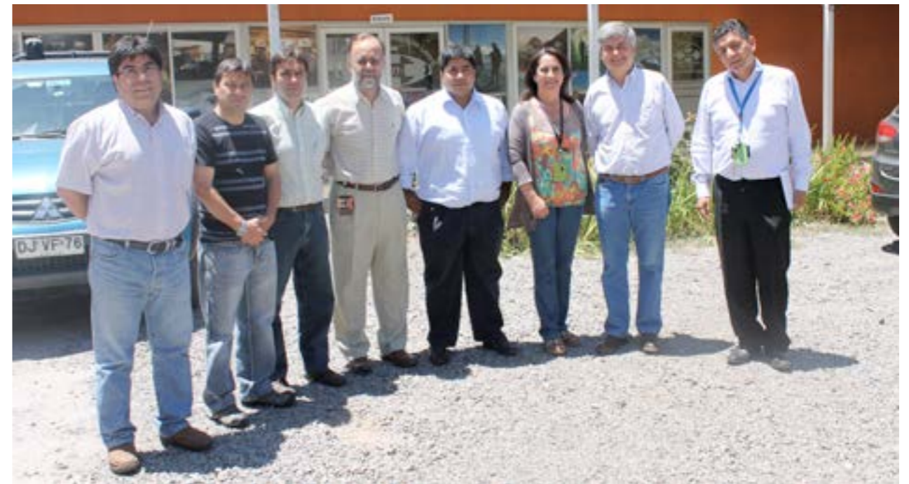
Sindicato Industrial de Integración Laboral (SILL)

En las conversaciones se evidenció la clara intención de mantener una comunicación fluida entre los trabajadores representados por los sindicatos y la Vicepresidencia liderada por Araneda, además de reafirmar el compromiso con el desarrollo de todos los trabajadores y velar por el cumplimiento de la seguridad en cada faena.