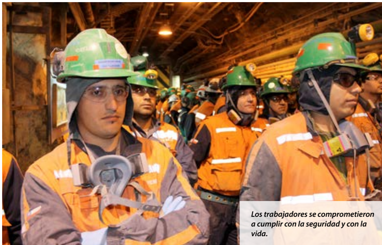
Los trabajadores se comprometieron a cumplir con la seguridad y con la vida.

fatalidad y sin accidentes con tiempo perdido”, dijo el ejecutivo.