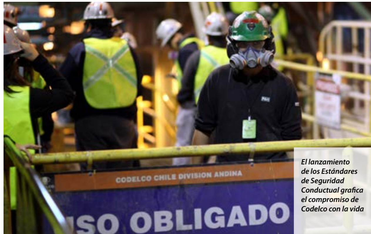
El lanzamiento de los Estándares de Seguridad Conductual grafica el compromiso de Codelco con la vida

Luego vino la presentación de los Estándares y las palabras del Presidente Ejecutivo, Thomas