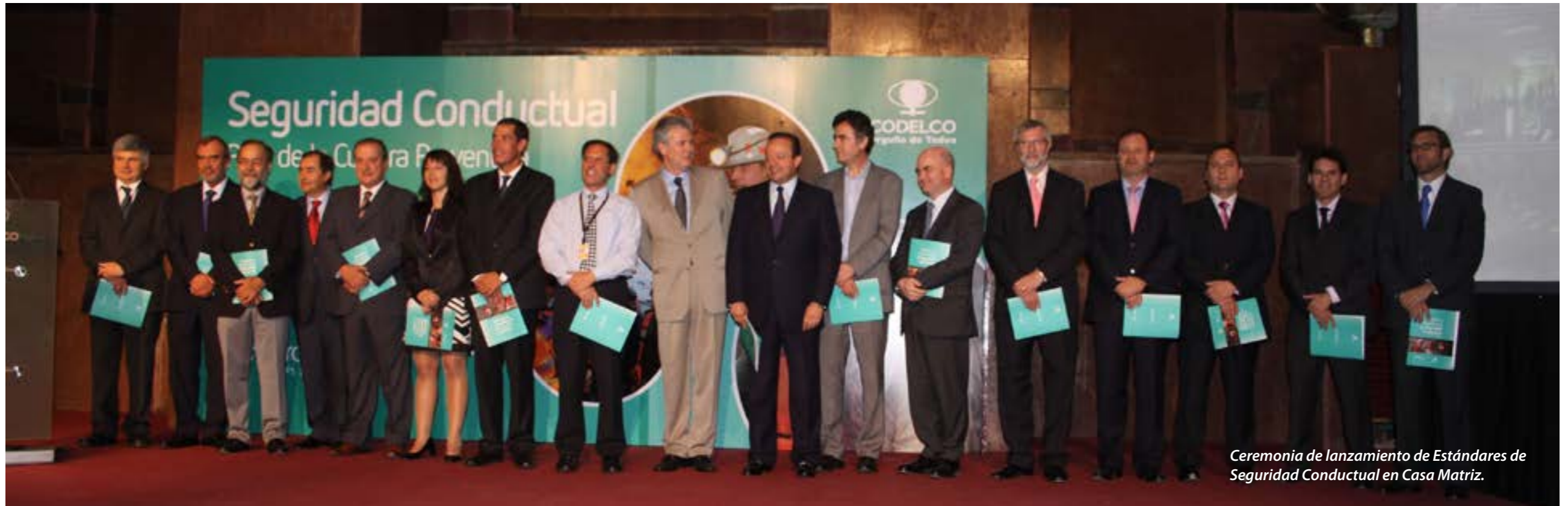
Ceremonia de lanzamiento de Estándares de Seguridad Conductual en Casa Matriz.