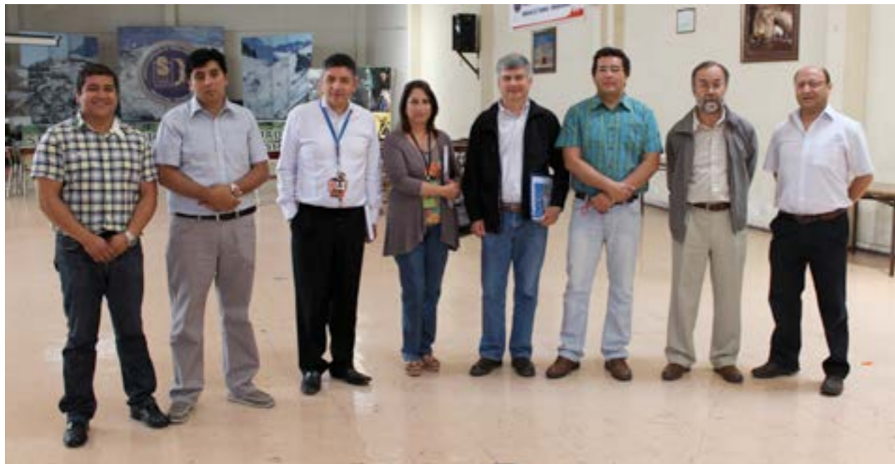
Sindicato Unificado de Trabajadores (SUT)