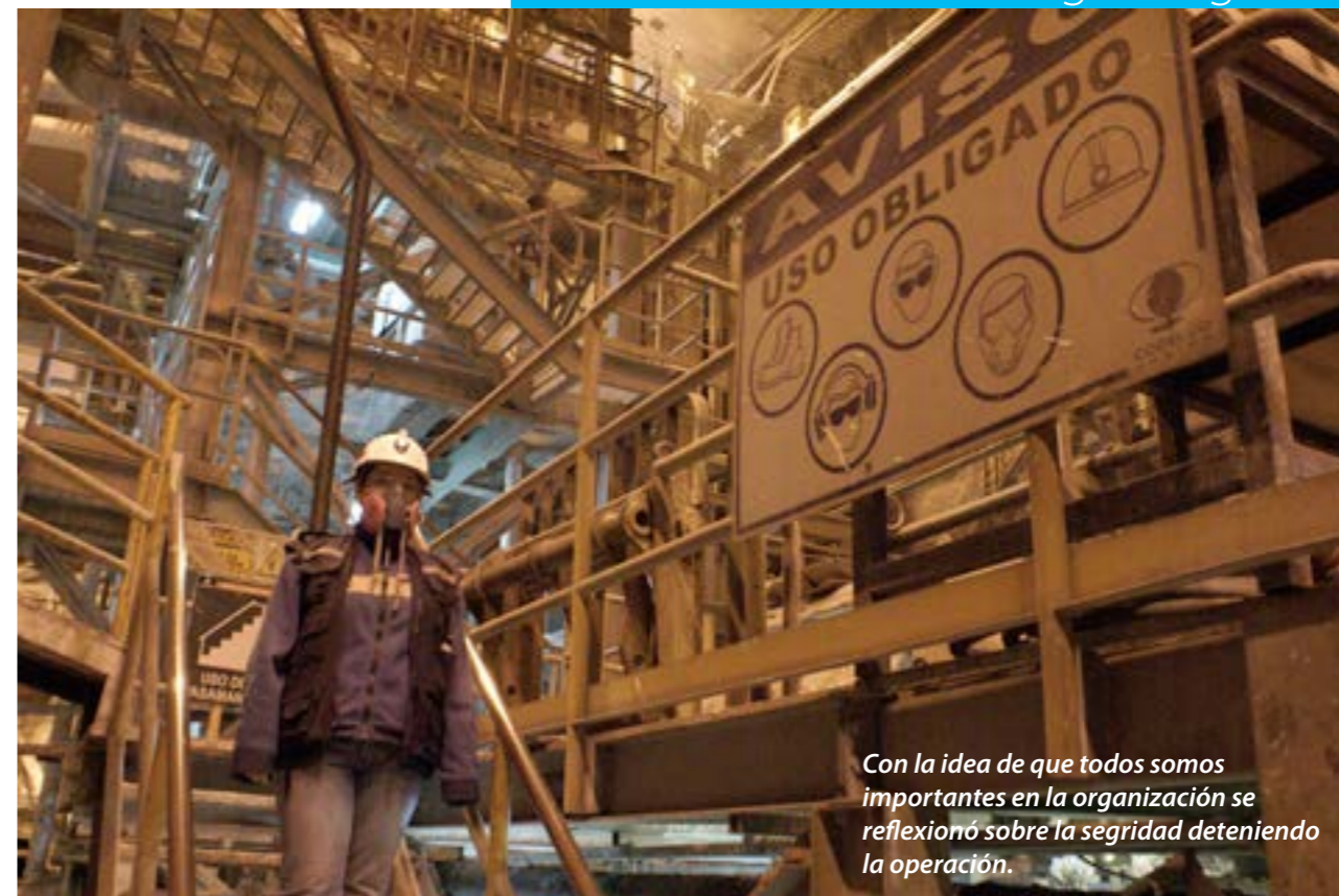
Con la idea de que todos somos importantes en la organización se reflexionó sobre la seguridad deteniendo la operación.