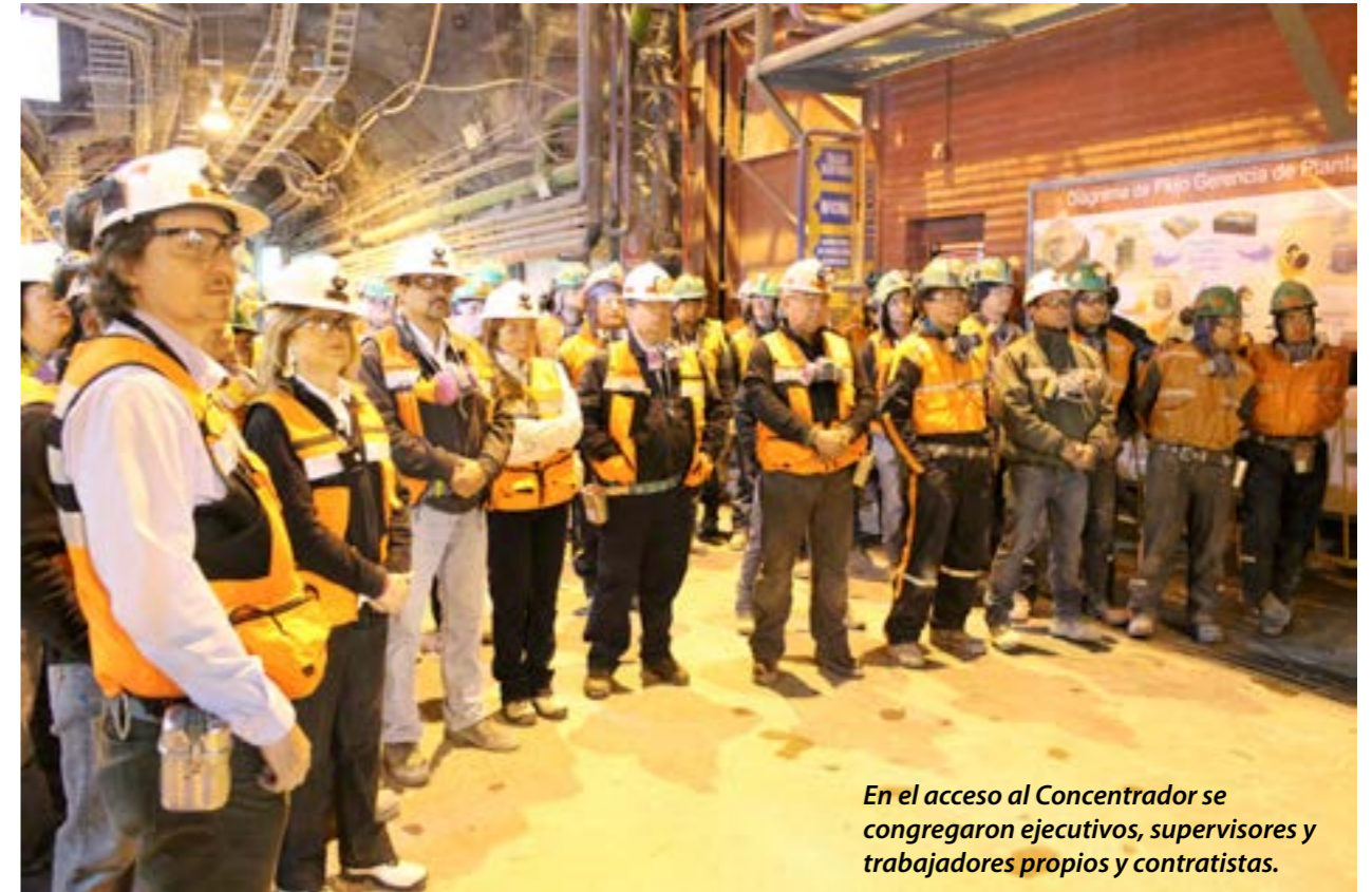
En el acceso al Concentrador se congregaron ejecutivos, supervisores y trabajadores propios y contratistas.