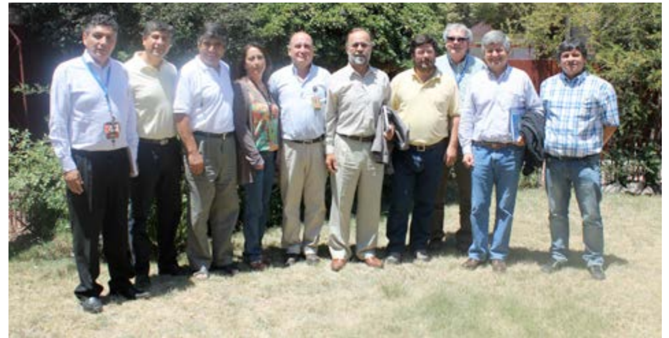
Sindicato de Supervisores de Andina (SISAN)