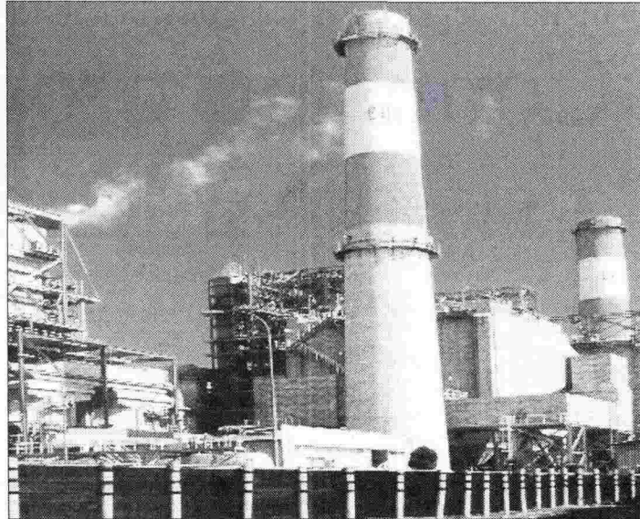
META. — La Refinería de Ventanas alcanzaría una capacidad de 500 mil toneladas de cobre fino al año.

mil millones en proyectos para los próximos cinco años, parte de los cuales se gastarán en las denominadas iniciativas estructurales de la zona centro.