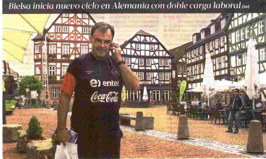
Bielsa inicia nuevo ciclo en Alemania con doble carga laboral [50]