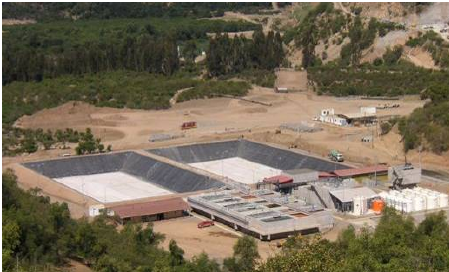
Planta de Abatimiento de Molibdeno, PAMO, División El Teniente