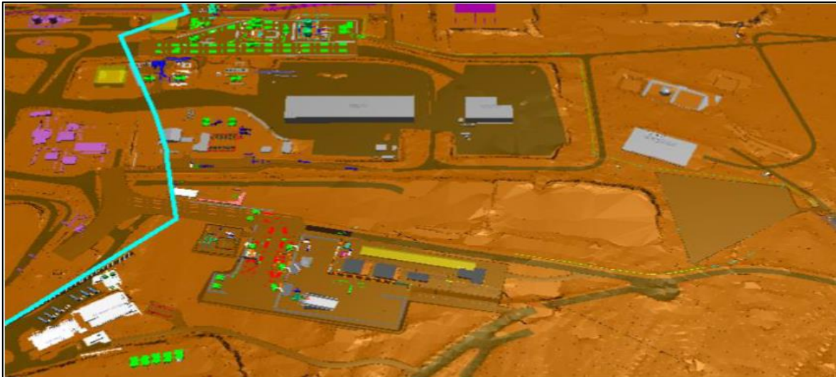
Figura N° 3: Ubicación área Infraestructura