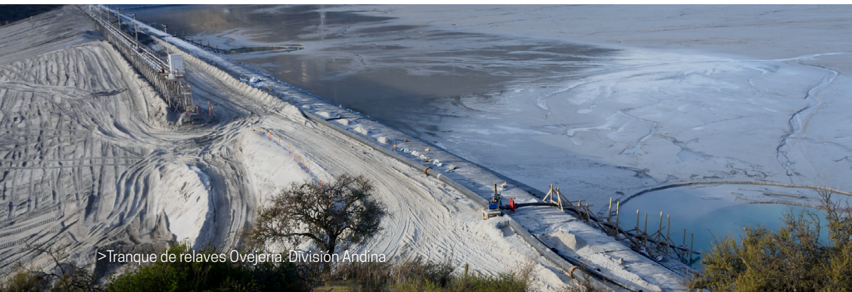
>Tranque de relaves Ovejera. División Andina

Adicionalmente, se avanzó según los planes definidos en cada división, en la puesta en marcha de los planes de preparación y respuesta ante emergencias en los depósitos de relaves.