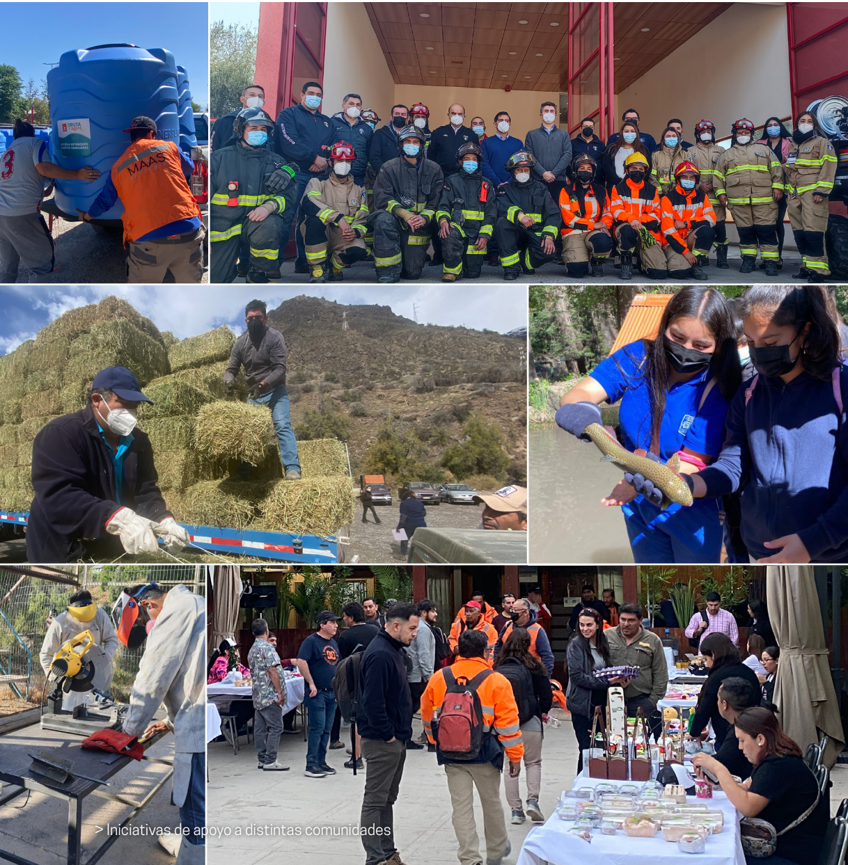
> Iniciativas de apoyo a distintas comunidades