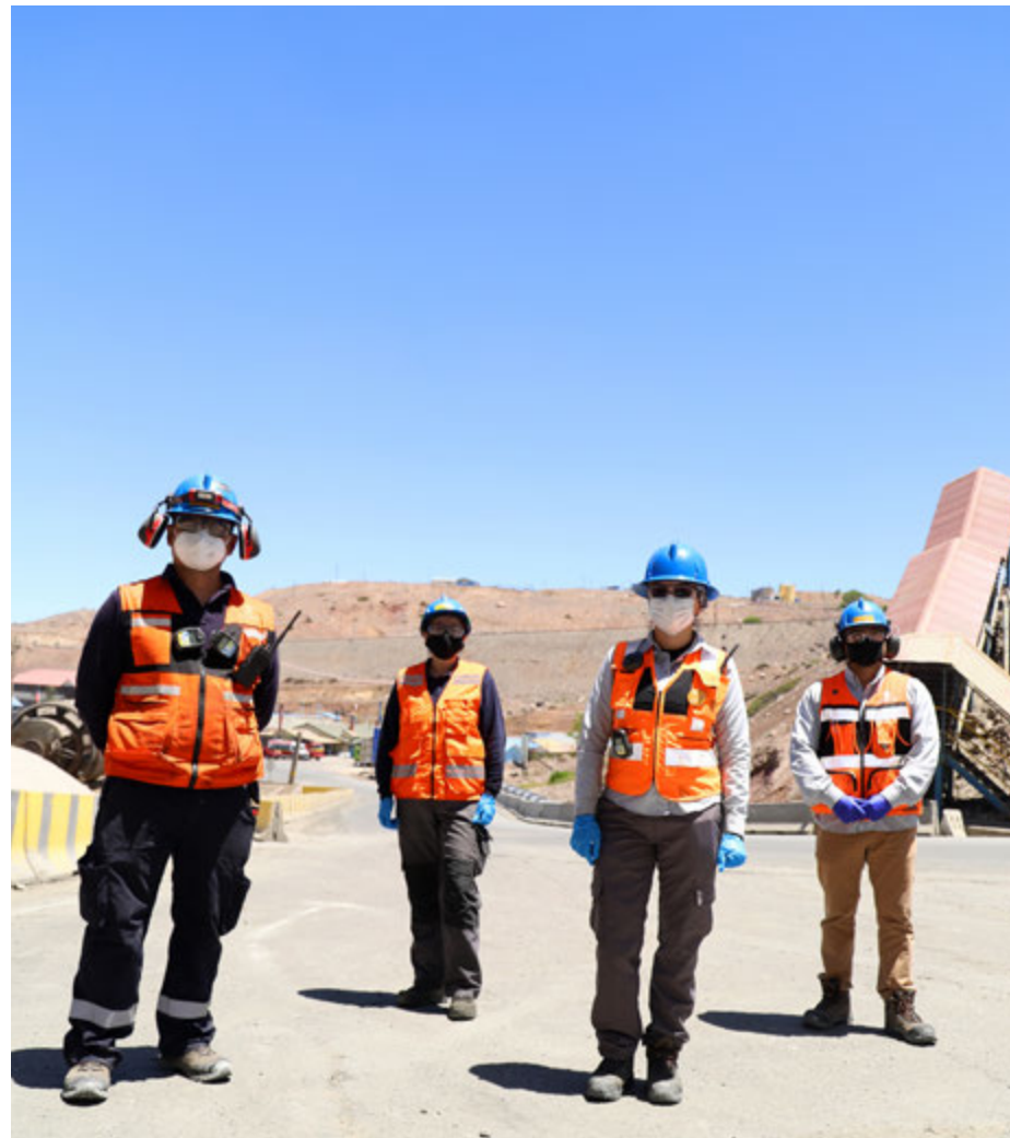
Siete divisiones mineras, una fundación y refinería, la Vicepresidencia de Proyectos y la Casa Matriz son nuestros centros de trabajo.

Nuestro compromiso de desarrollo sustentable tiene objetivos concretos a 2030 con indicadores medibles respecto de la huella de carbono, la huella hídrica, la economía circular , el estándar de nuestros depósitos de relave y el desarrollo de los territorios con valor social .