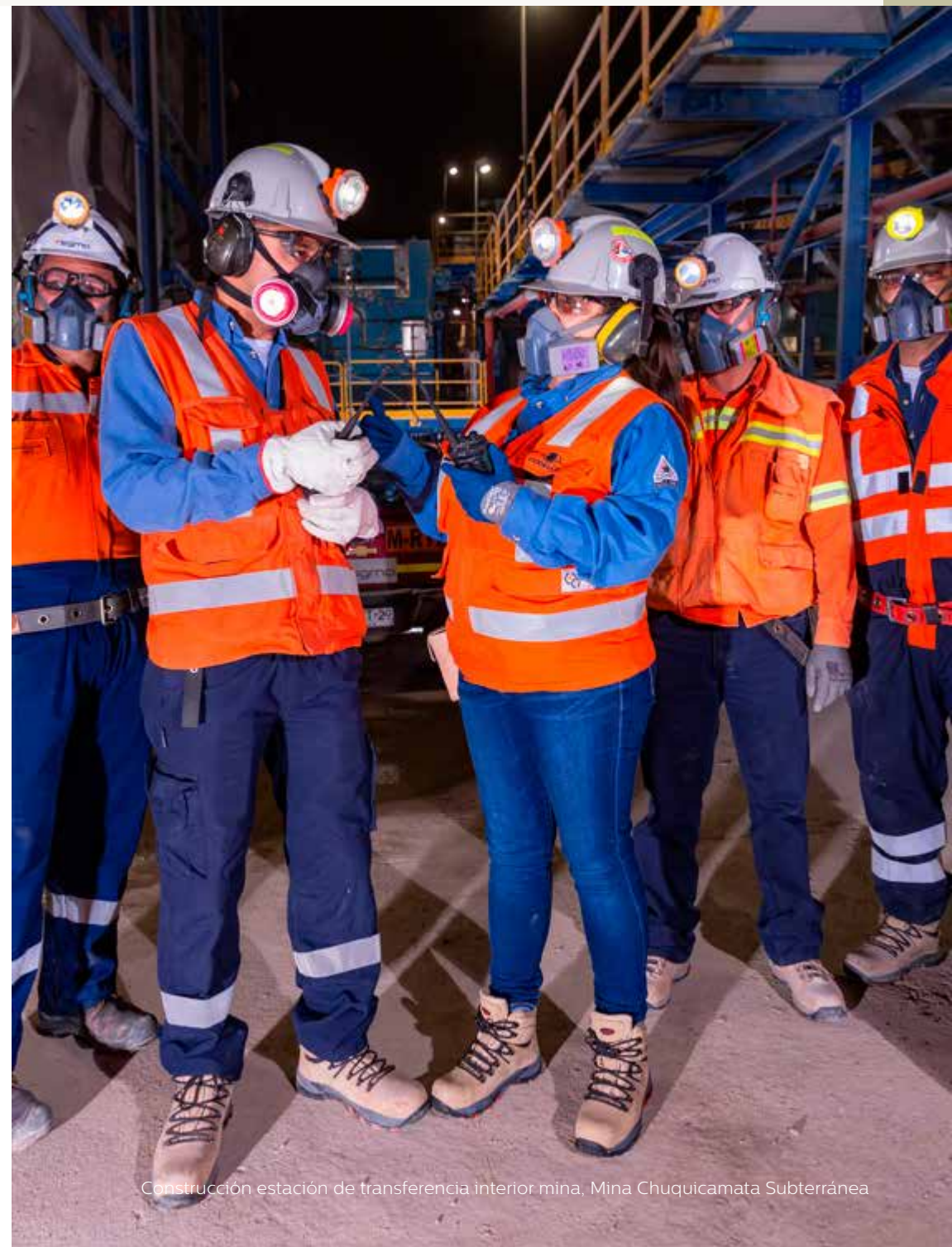
Construcción estación de transferencia interior mina, Mina Chuquicamata Subterránea

Los recursos geológicos del inventario de 2019 aumentaron 0,5% en cobre fino, debido principalmente al avance de las campañas de reconocimiento en el sector sur de División Ministro Hales.