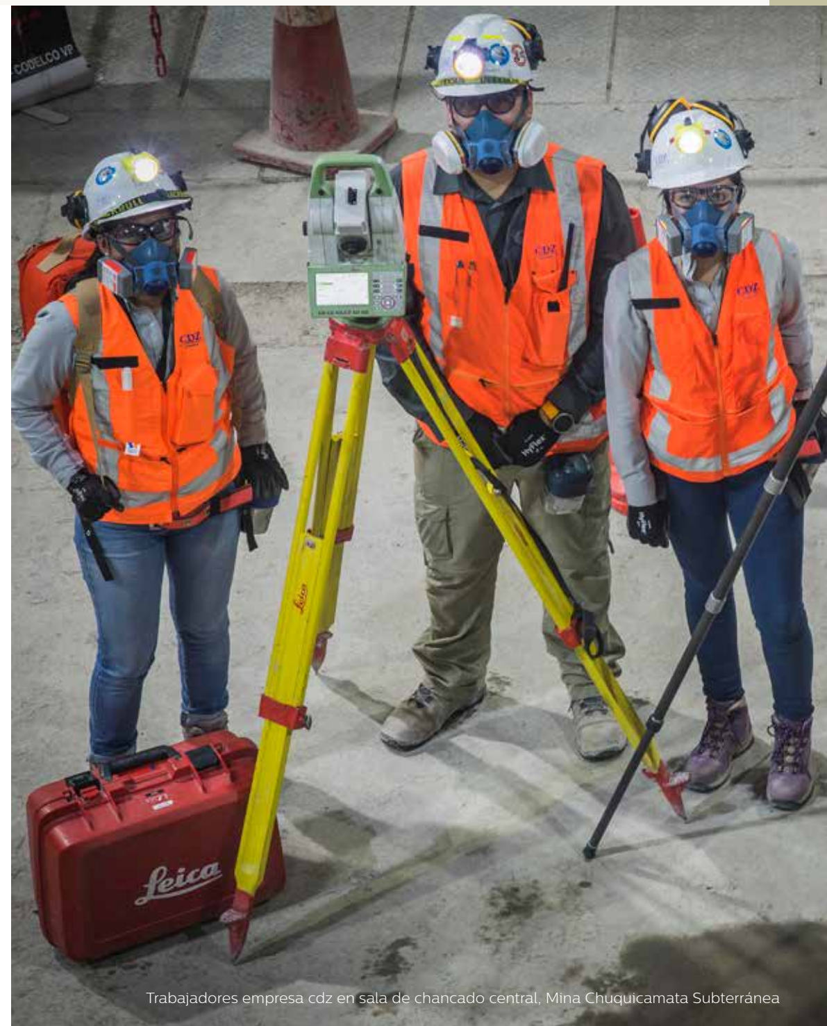
Trabajadores empresa cdz en sala de chancado central, Mina Chuquicamata Subterránea

Las siguientes personas competentes suscriben los reportes públicos de recursos y reservas, que constituyen la base de información utilizada en la