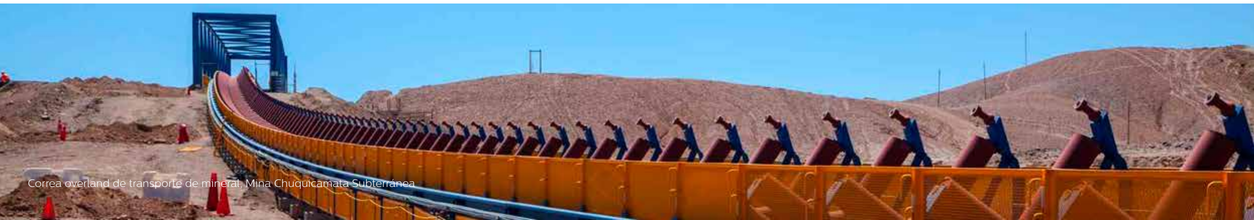
Correa overland de transporte de mineral, Mina Chuquicamata Subterránea