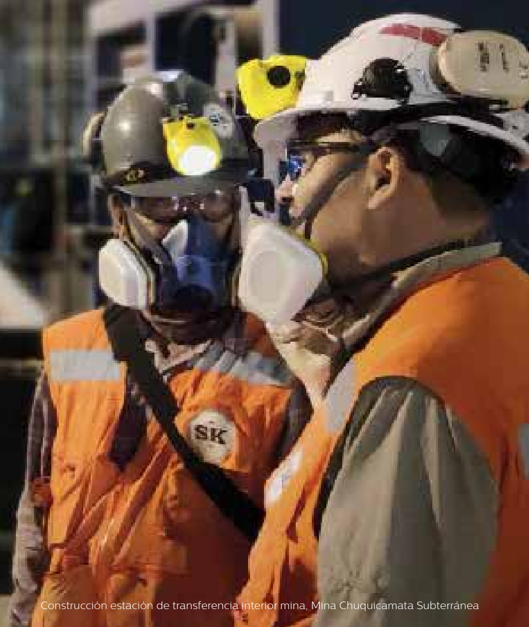
Construcción estación de transferencia interior mina, Mina Chuquicamata Subterránea

Distintos factores como las lluvias en el norte de Chile en febrero, la huelga de trabajadores en mayo, además de temas operacionales y de mantención en Chuquicamata y Andina explican nuestra caída en la producción. Ésta, a su vez, sumada a la guerra comercial entre China y Estados Unidos que influyó en la volatilidad del precio del cobre, impactaron en los excedentes que generamos. Para 2020, el riguroso plan estratégico de negocios busca revertir esta tendencia.