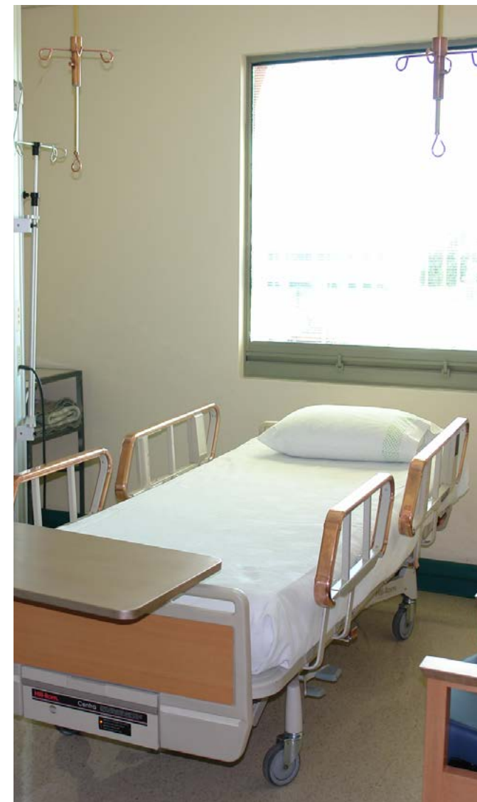
Intervención con cobre antimicrobiano. Hospital del Cobre, ubicado en Calama.