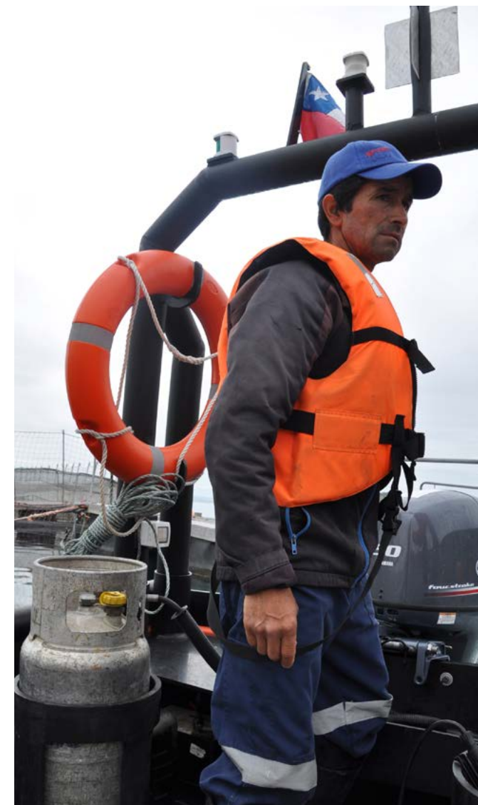
Mantenimiento jaulas de cobre de EcoSea.

EcoSea Farming S.A. no tiene contratos con Codelco.