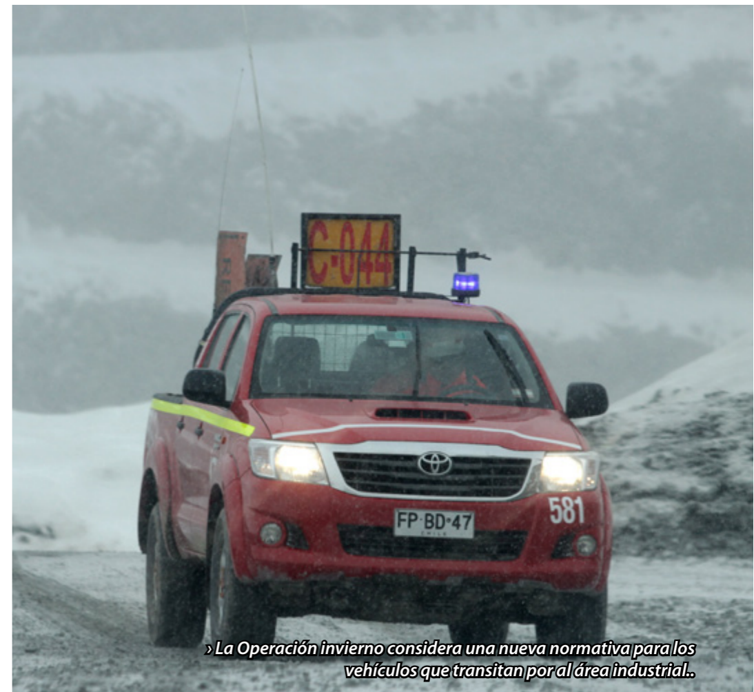
» La Operación invierno considera una nueva normativa para los vehículos que transitan por el área industrial.