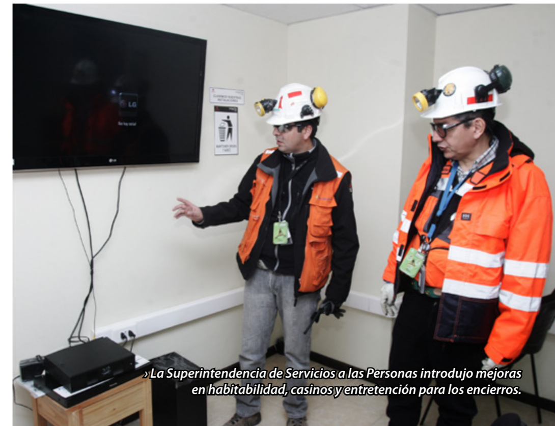
» La Superintendencia de Servicios a las Personas introdujo mejoras en habitabilidad, casinos y entretenimiento para los encierros.