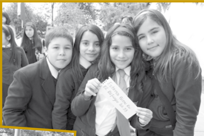
Los niños recibieron una copia del famoso mensaje que enviaron "los 33" desde las profundidades de la Mina San José.