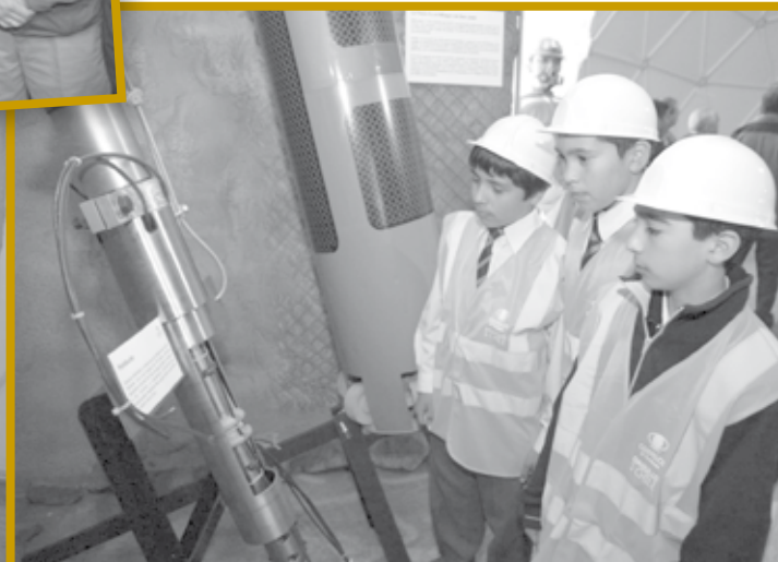
Las máquinas utilizadas para perforar y réplicas de las cápsulas Fénix 2 son parte de la exposición.