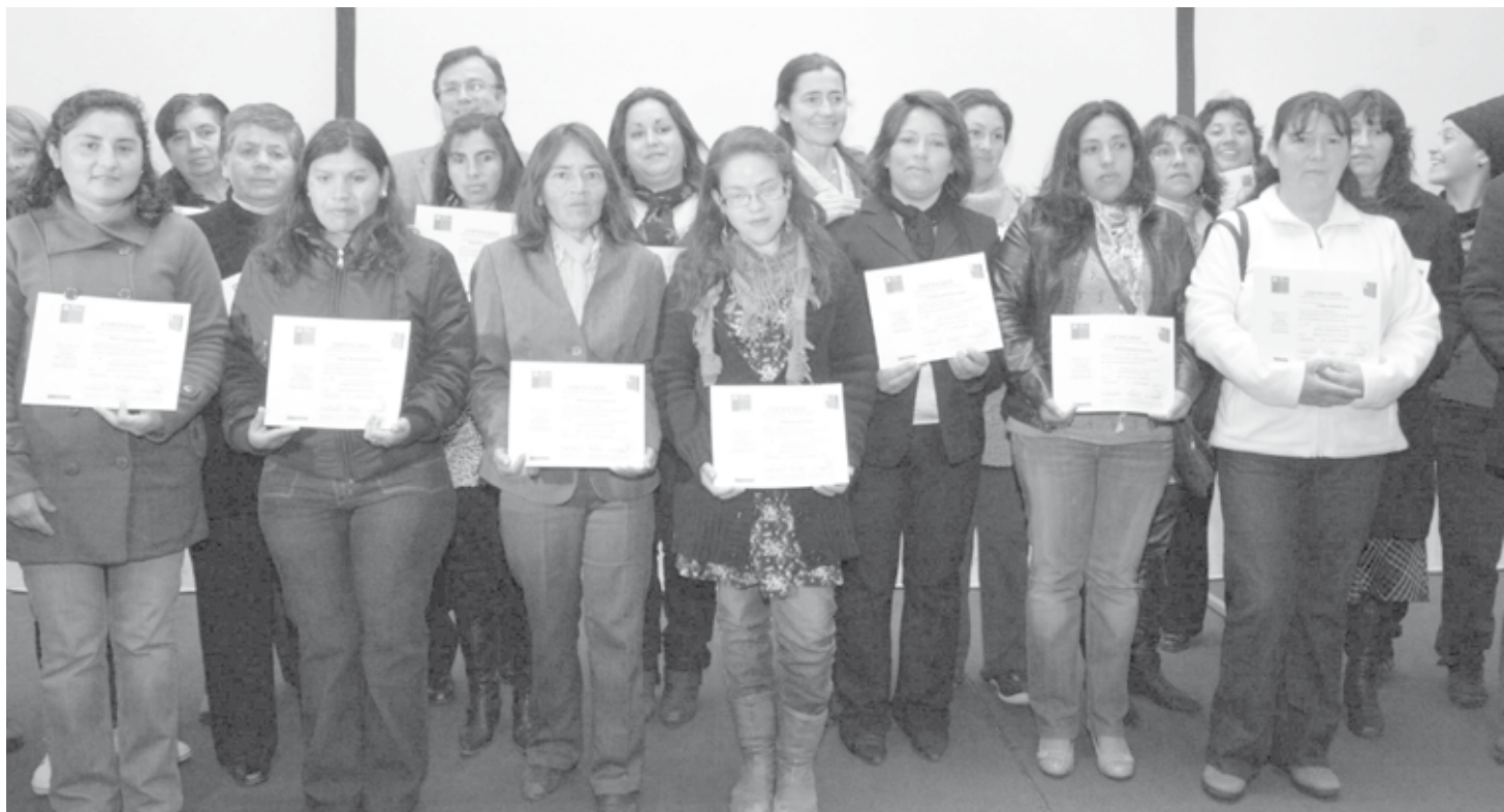
Vecinas de las comunas de Rancagua, Machali, Graneros y Requinoa recibieron sus certificados.