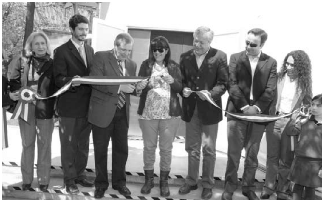
Con el corte de cinta se dio por inaugurado el Domo Teniente con una muestra que recuerda el Rescate en la Mina San José.

un país para rescatar a los mineros atrapados. Conocer las labores de los rescatistas, la garra de los 33 y todo lo que rodeó a esta hazaña". Aseguró que tras el incidente "el Gobierno también tomó el compromiso con la minería chilena. Por ello hoy contamos más de mil monitores de seguridad en la pequeña minería y nuestra región cuenta con 24