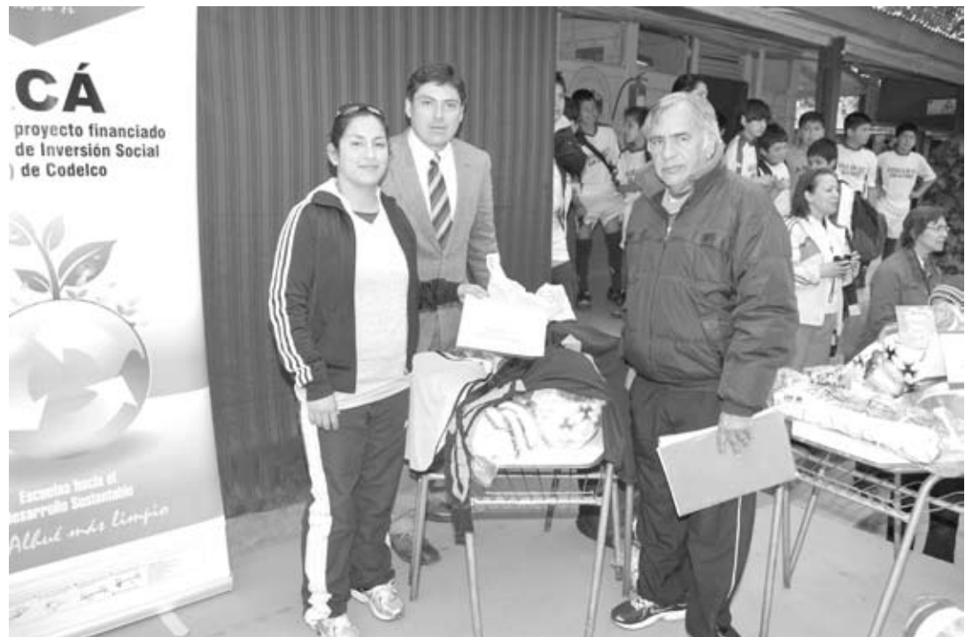
Los cinco colegios municipales de Alhué fueron beneficiados por el Proyecto “Escuelas Saludables”.