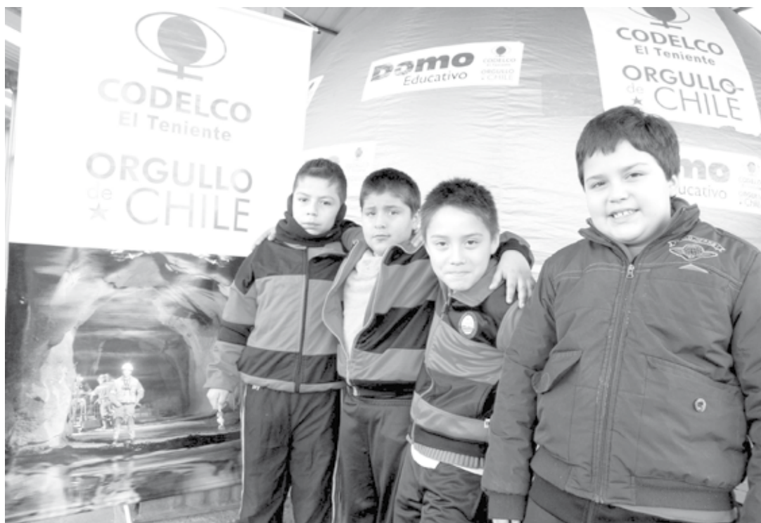
El colegio El Cobre de Rancagua también recibió la visita del Domo.

jóvenes conozcan un poco más de la historia del cobre, ya que somos una zona que se dedica a este