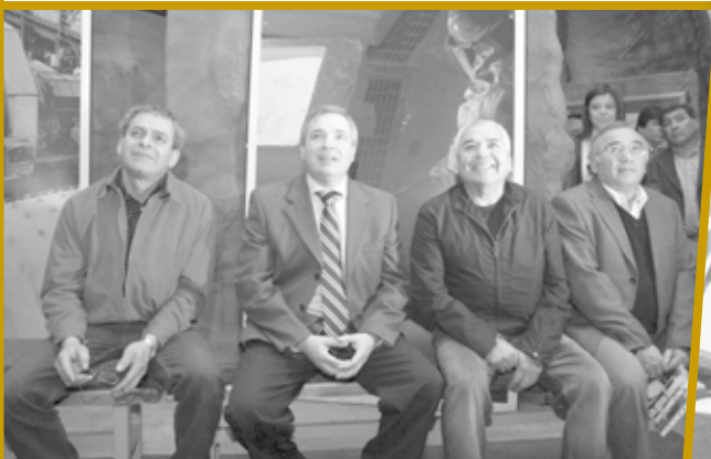
La exposición también explica lo que será el futuro de la minería chilena y qué papel juega Codelco.