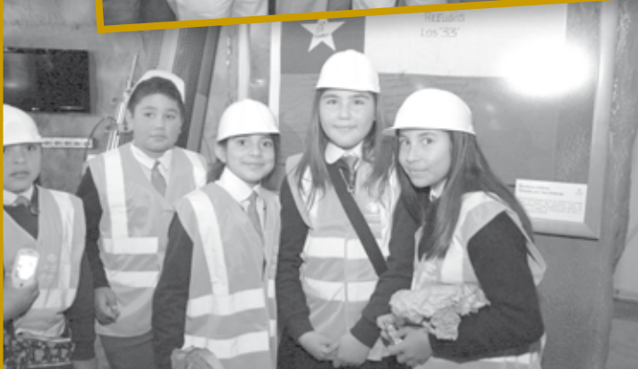
Una bandera de la Mina San José es parte de la muestra.