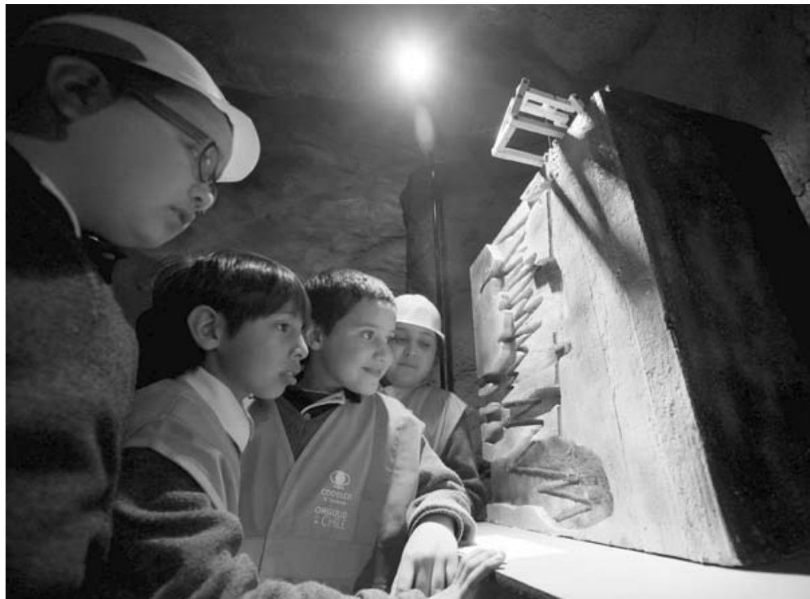
Al interior del Domo, se puede observar la maqueta de la mina San José y dimensionar la complejidad técnica del rescate.