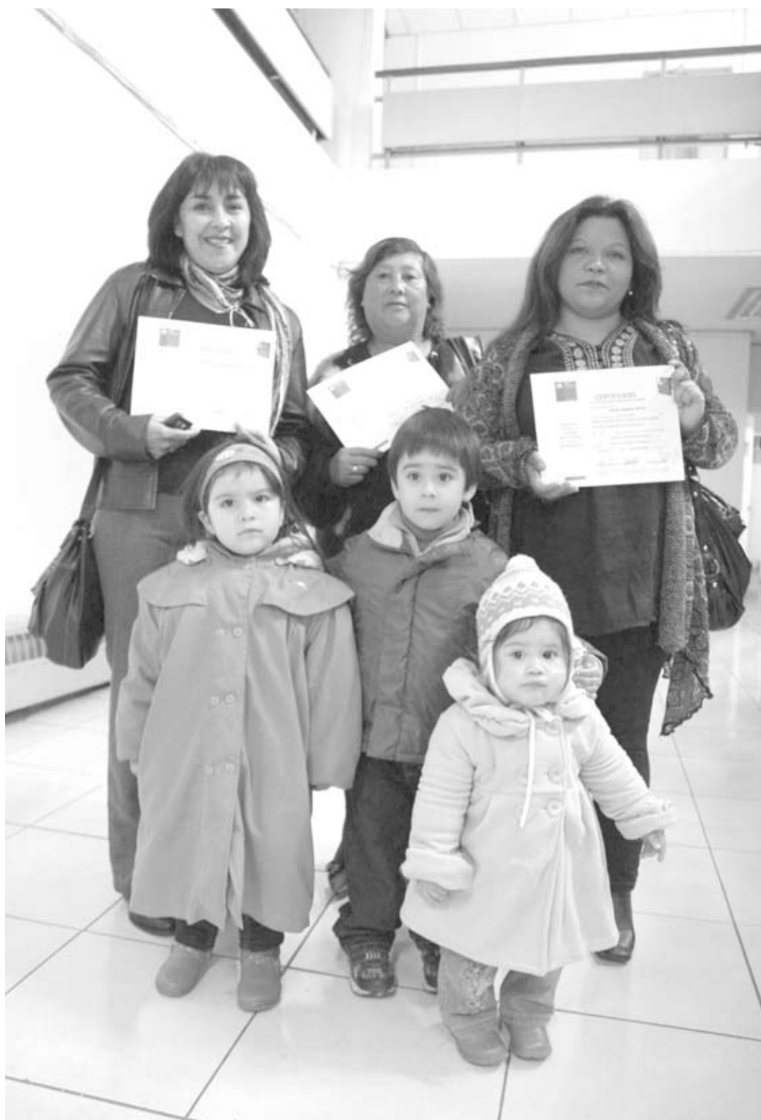
99 personas, en su mayoría dueñas de casa, participaron en los cursos realizados por División El Teniente.