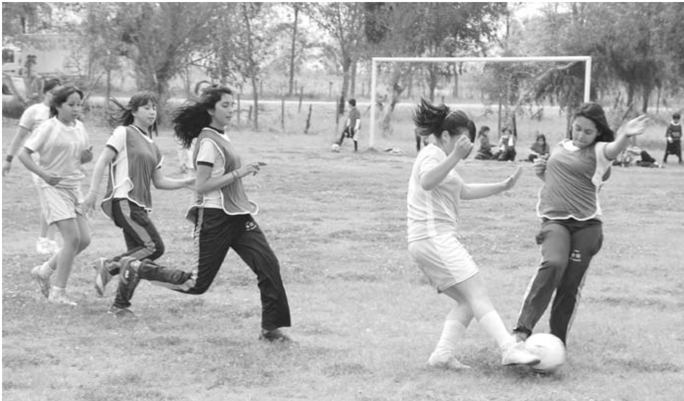
Los Colegios municipales de la comuna dieron vida a las olimpiadas de Alhué.