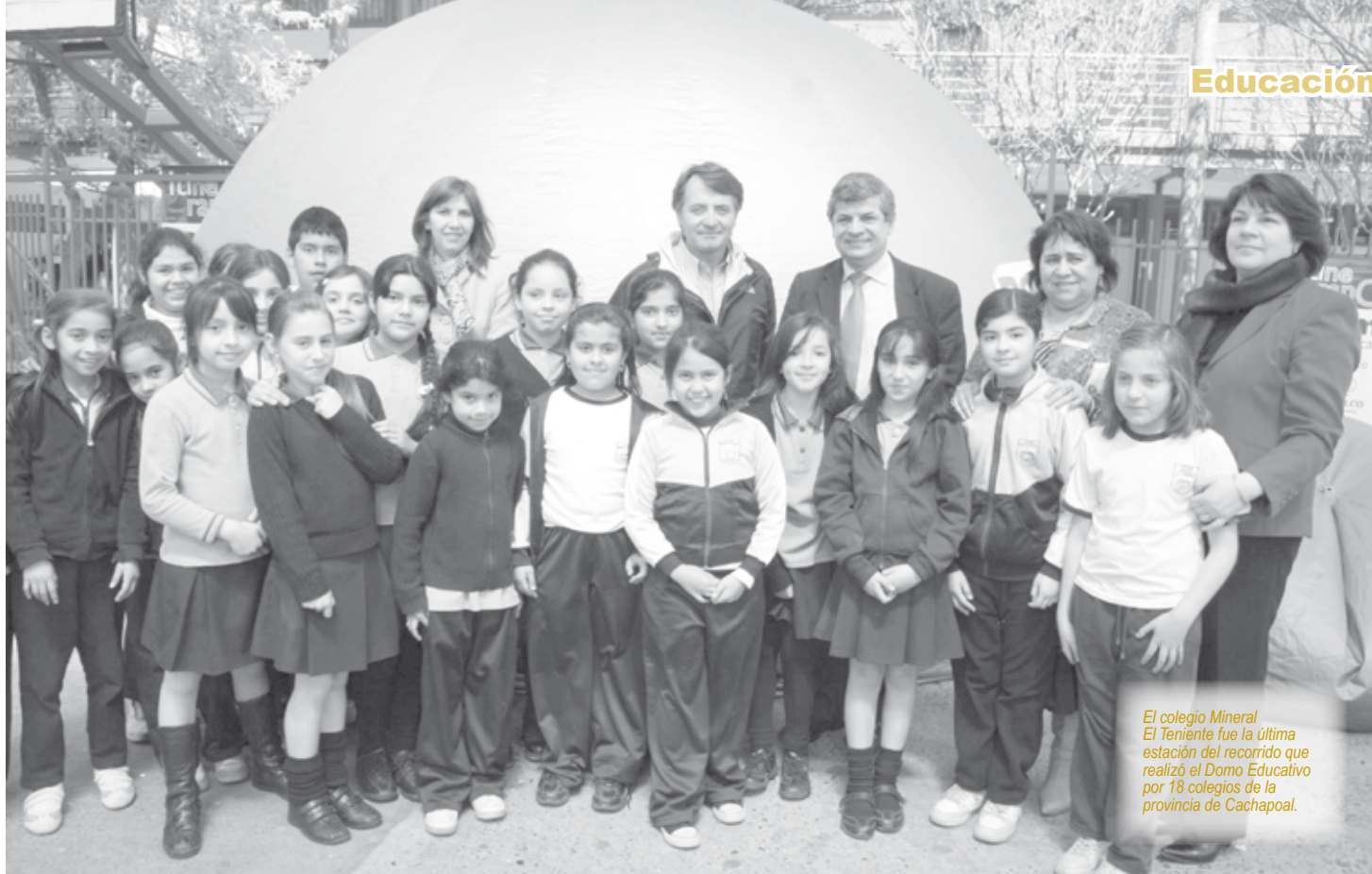
El colegio Mineral El Teniente fue la última estación del recorrido que realizó el Domo Educativo por 18 colegios de la provincia de Cachapoal.

Iniciativa de El Teniente culminó su tarea este año 2011