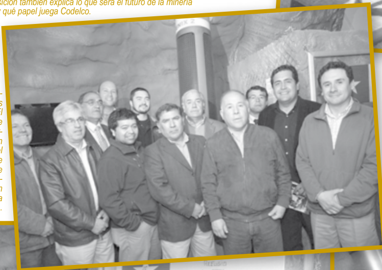
Trabajadores de El Teniente que participaron del rescate durante la inauguración de la muestra.