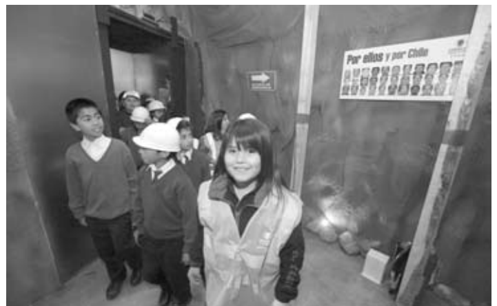
La muestra permite a los visitantes ingresar virtualmente a la mina y conocer los aspectos más importantes del rescate.