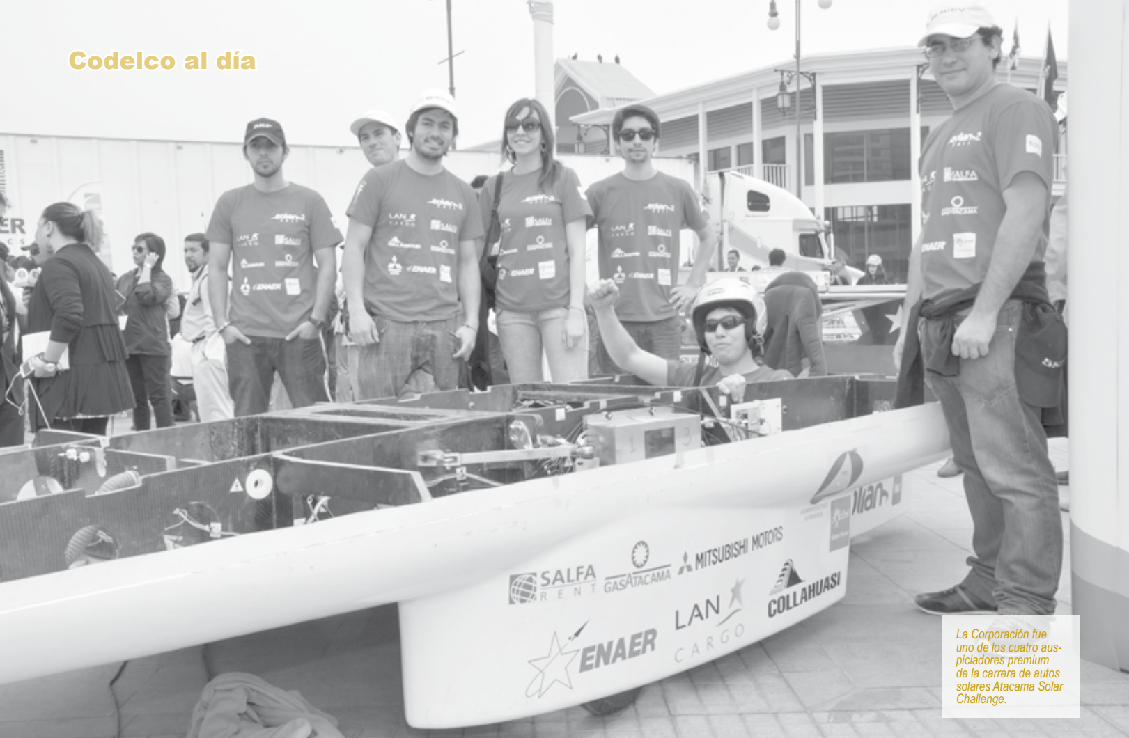
La Corporación fue uno de los cuatro auspiciadores premium de la carrera de autos solares Atacama Solar Challenge.