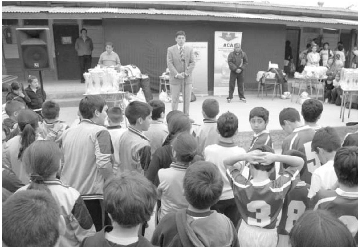
La entrega de los implementos deportivos se realizó durante la inauguración de las Olimpiadas del Alhué.