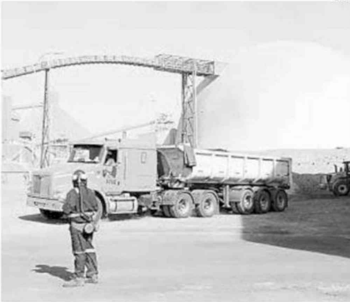
40 CAMIONES TRASLADARÁN EL MINERAL DE DMH HASTA ANTOFAGASTA.